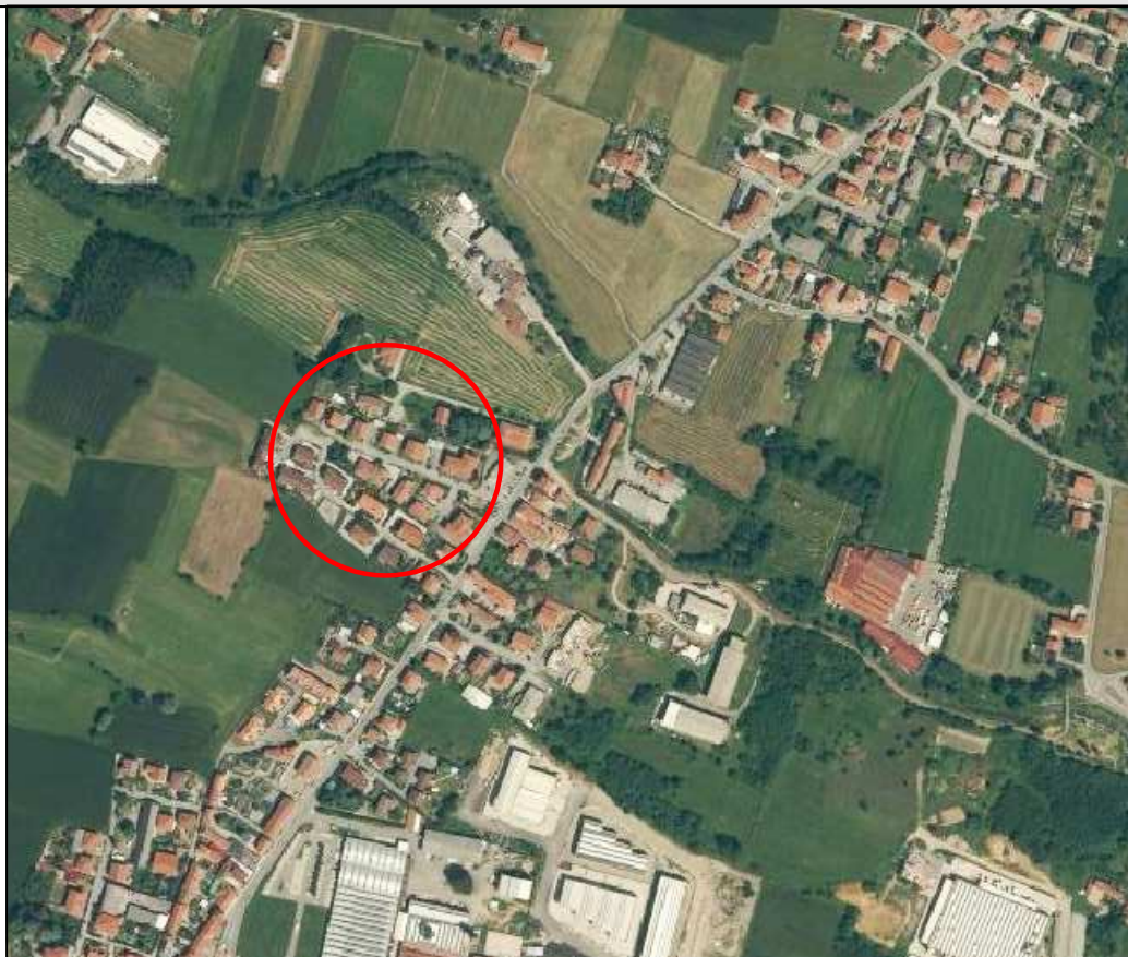
ESTRATTO VISTA AEREA TRATTO DI INTERVENTO